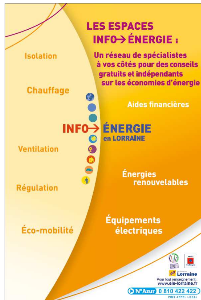
Edition 2010 Format 40x60